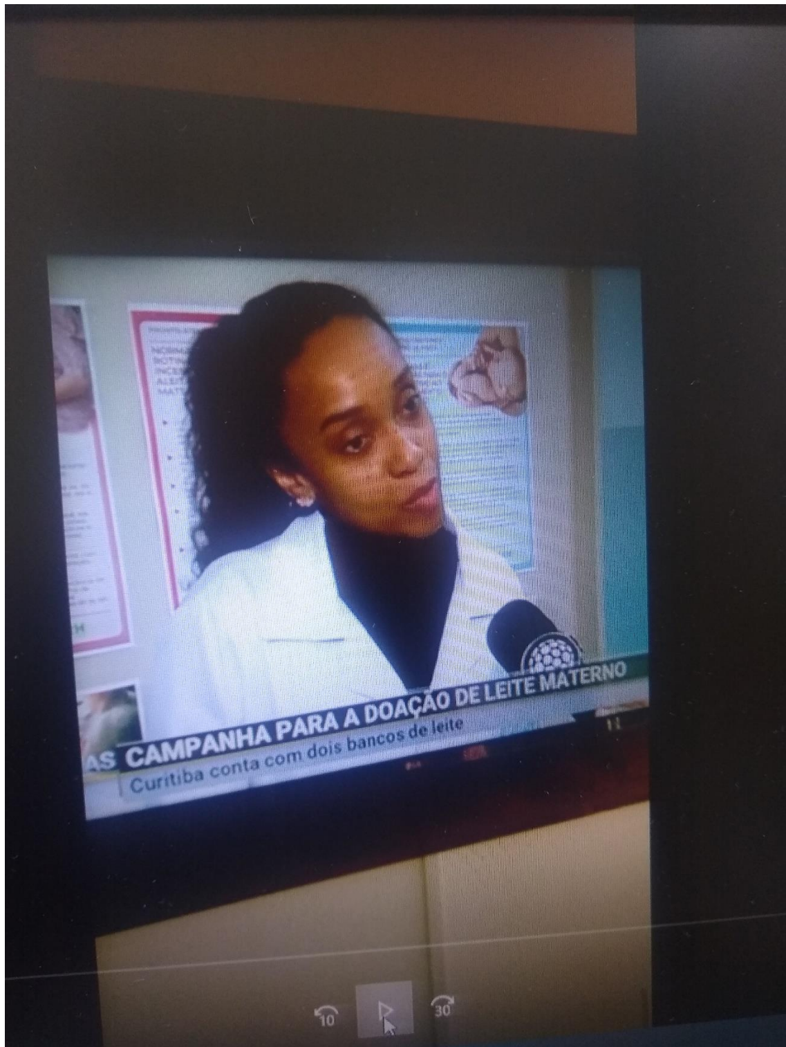
ENTREVISTA PARA REDE MASSA SOBRE CAMPANHA DE DOAÇÃO DE LEITE HUMANO 19/05/2023