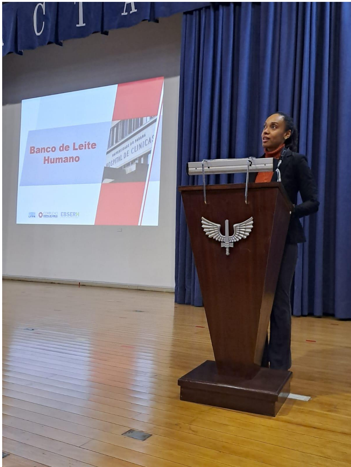
PALESTRA SOBRE BANCO DE LEITE HUMANO NO CINDACTA II 25/05/2023