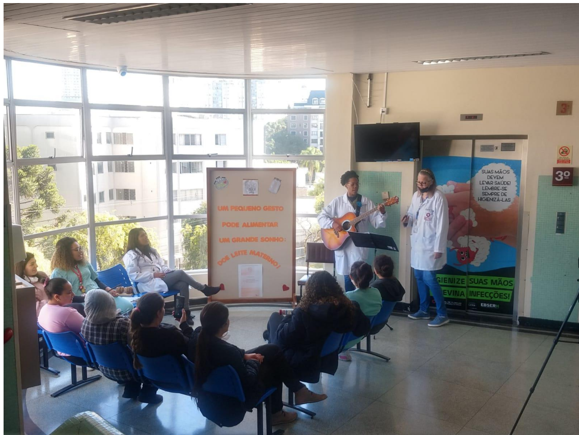
RODA DE CONVERSA COM MÚSICA SOBRE DOAÇÃO DE LEITE HUMANO PARA MÃES DE BEBÊS INTERNADOS NA UTI NEONATAL 18/05/2023