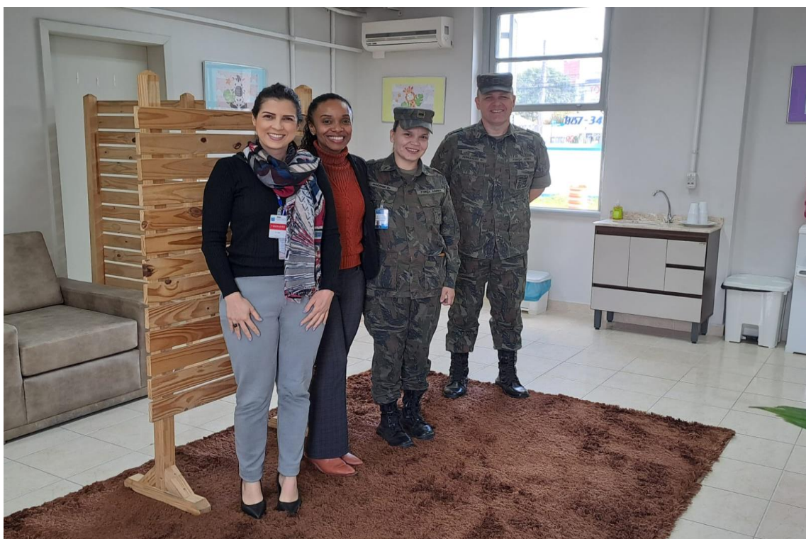
INAUGURAÇÃO DA SALA DE AMAMENTAÇÃO NO CINDACTA II – 25/05/2023