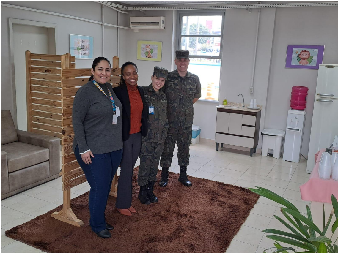
INAUGURAÇÃO DA SALA DE AMAMENTAÇÃO NO CINDACTA II – 25/05/2023