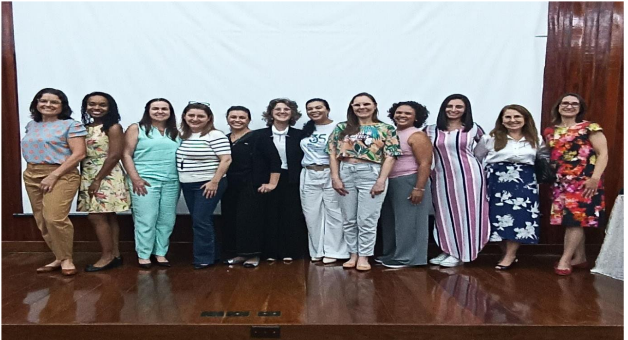
PARTICIPAÇÃO NA REUNIÃO COMISSÃO ESTADUAL DE BANCOS DE LEITE HUMANO EM 22 NOVEMBRO DE 2023