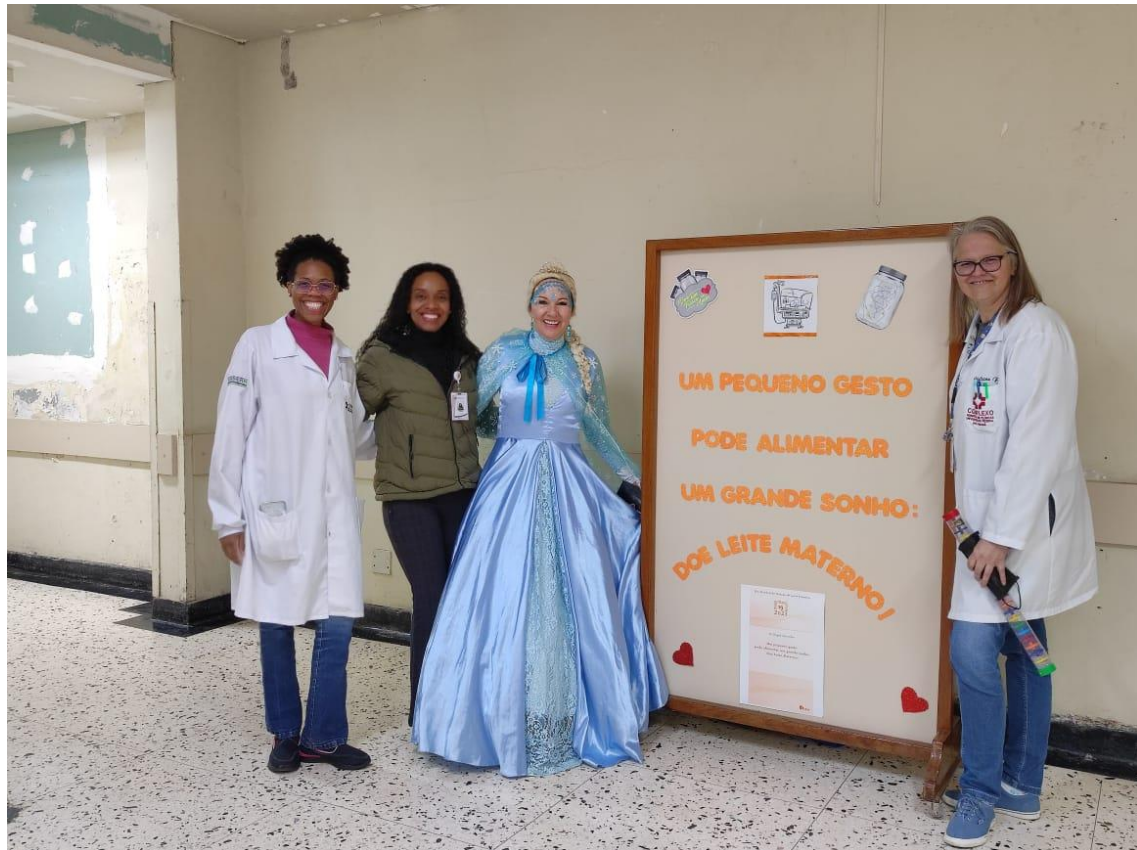
PROJETO MUSICAL SOBRE DOAÇÃO DE LEITE HUMANO COM A PERSONAGEM FROZEN NO HALL DE ENTRADA DO COMPLEXO HOSPITAL DE CLÍNICAS 17/05/2023