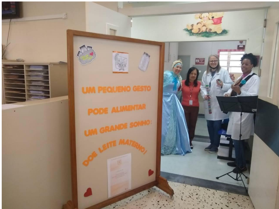
PROJETO MUSICAL SOBRE DOAÇÃO DE LEITE HUMANO COM O COMITÊ DE HUMANIZAÇÃO E A PERSONAGEM FROZEN NO PRONTO ATENDIMENTO DA PEDIATRIA 17/05/2023