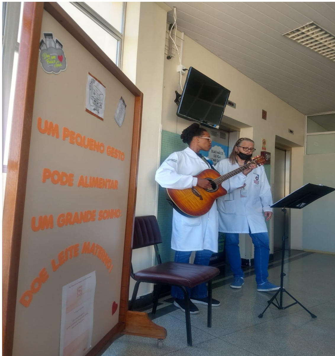
PROJETO MUSICAL SOBRE A DOAÇÃO DE LEITE HUMANO – 18/05/2023