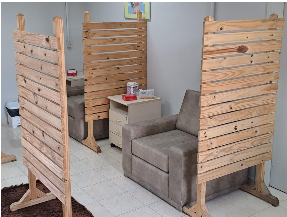
SALA DE APOIO A AMAMENTAÇÃO – 25/05/2023