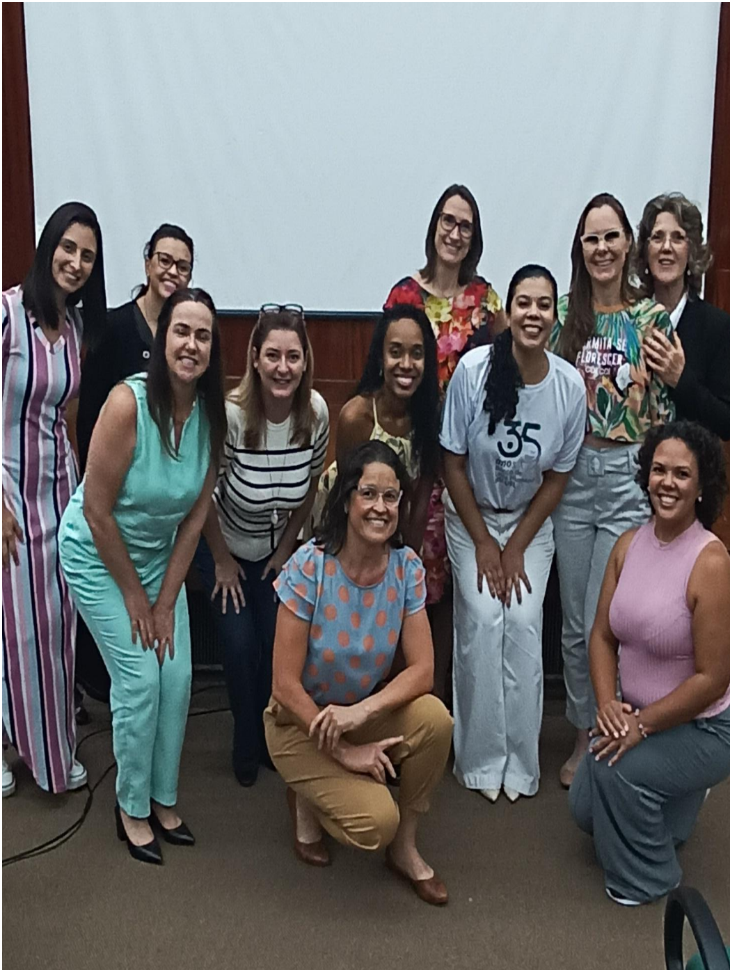
PARTICIPAÇÃO NA REUNIÃO COMISSÃO ESTADUAL DE BANCOS DE LEITE HUMANO EM 22 NOVEMBRO DE 2023