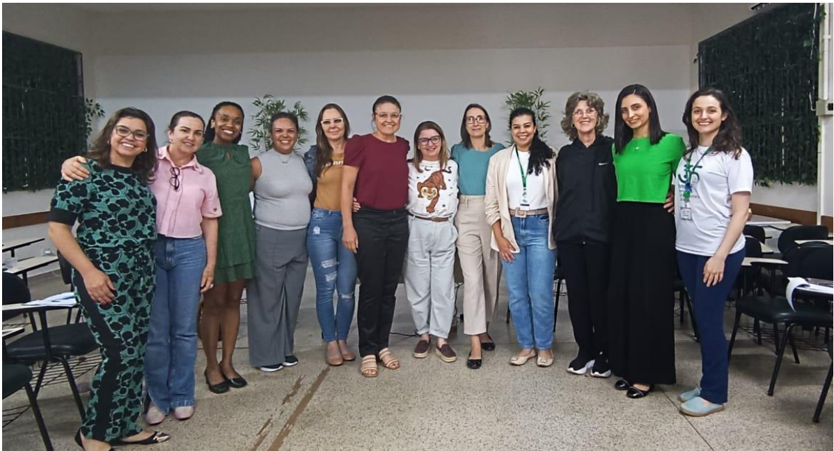
PARTICIPAÇÃO NA REUNIÃO COMISSÃO ESTADUAL DE BANCOS DE LEITE HUMANO EM 23 DE NOVEMBRO DE 2023